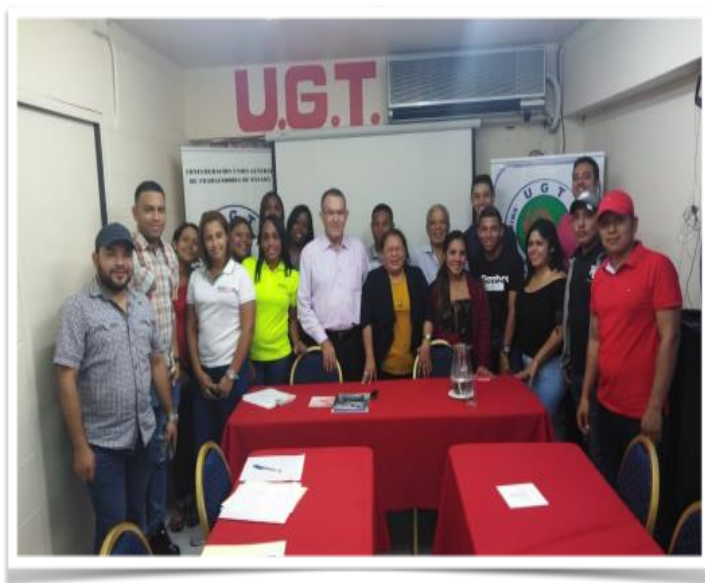
Seminario, Juventud y Sindicalismo, UGT, marzo, 2019

A partir de reflexiones y debates recientes realizados en seminario sobre juventud y sindicalismo, jóvenes de la UGT han planteado sus preocupaciones y visiones sobre los desafíos del mundo del trabajo. A los jóvenes les preocupa: